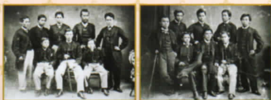
薩摩藩英国留学生のうち16名(尚古集成館蔵)

The Bedford Times 1865.8.1記事より ベッドフォードのブリタニア鉄工所を訪ねた薩摩スチューデント一行は、そこで生産される機械類を興味深く見学した。さらに、市長でもある工場長と懇談を共にした後、蒸気鋸のデモンストレーションを見学、試運転にチャレンジしたことを地元の新聞は伝えている。