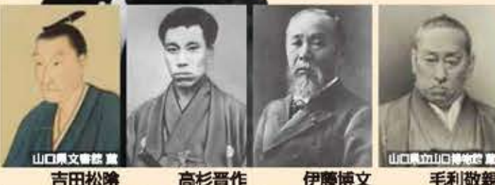
山口県立山口博物館 吉田松陰 高杉晋作 伊藤博文 毛利敬親