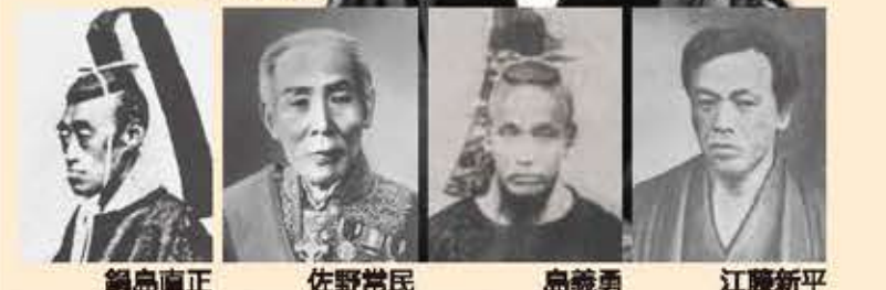
鍋島直正 佐野常民 島義勇 江藤新平