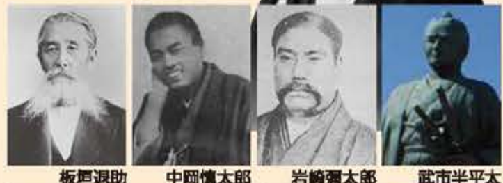
板垣退助 中岡慎太郎 岩崎彌太郎 武市半平太