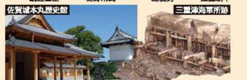
佐賀城本丸歴史館