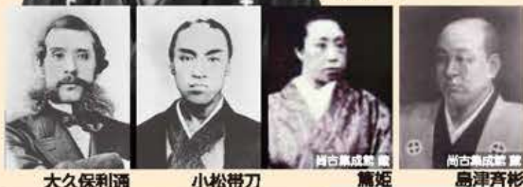
大久保利通 小松帯刀 尚古集成就 島津斉彬