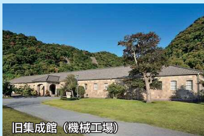
旧集成館 (機械工場)

薩摩藩においては、1851年に藩主となった島津斉彬が近代化の必要性をいち早く認識し、興した「集成館事業」を通して、反射炉の建造や工場の機械化など、後に日本が急速な産業化を遂げるための礎を築いていきました。現在、鹿児島には「旧集成館」、「寺山炭窯跡」及び「関吉の疎水溝」の3つの構成資産があります。